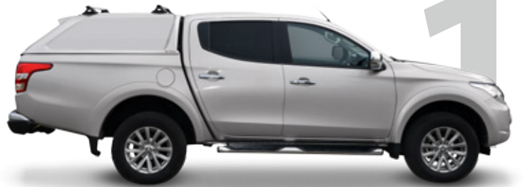
HARDTOP RH4 DC STANDARD