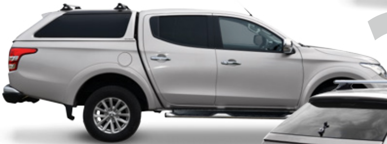
HARDTOP RH4 DC SPECIAL