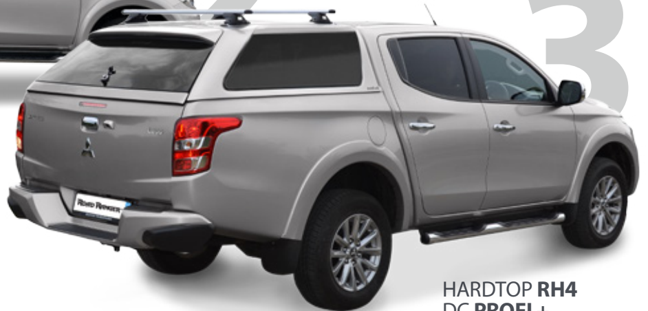
HARDTOP RH4 DC PROFI +